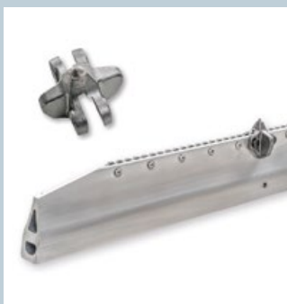
Steg / Cleats