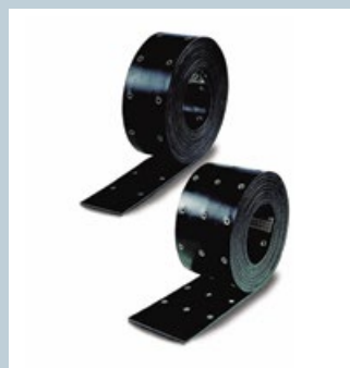
Bänder / Belts