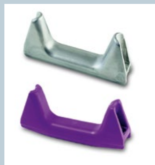
Spurbügel / Tireguide

© HANS HALL GmbH, 05/2019 Fotonachweise / Photo credits: Ingo Rack, HANS HALL, Adobe Stock. Änderungen, Druckfehler und Irrtümer bleiben vorbehalten. Farbabweichungen in den Abbildungen von den Original-Produkten sind drucktechnisch bedingt. Changes, misprints and errors excepted. Color deviations are due to printing technology.